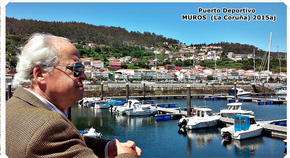
Puerto Deportivo MUROS (La Coruña) 2015aj