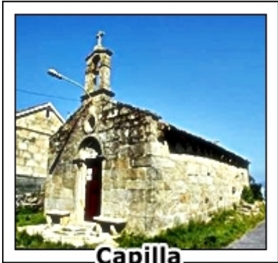
Capilla Espíritu Santo MUROS (La Coruña)

Capilla del Espíritu Santo de estilo gótico, está reconstruida en el año 1927 con piedra de cantera y se compone de una planta con arco de medio punto y una bóveda de cañón. El exterior con tejado clásico, puerta románica, óculo y campanario con una cruz en lo alto. Se dice, se cuenta, se narra que está construida en este lugar porque lo señaló el destino, me explico, el carro que transportaba la imagen se rompió en este lugar y la imagen, que vemos en la capilla, se encontró en la playa. Dicho y hecho, la capilla está en la carretera que va de Muros a Louro.