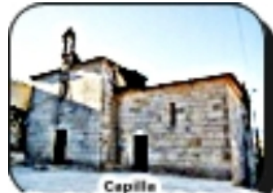
Capilla Nuestra Señora de la Angustia MUROS (La Coruña)

Capilla Nuestra Señora de la Angustia , siglo XVII, formó parte de la iglesia parroquial donde se hacían los entierros.