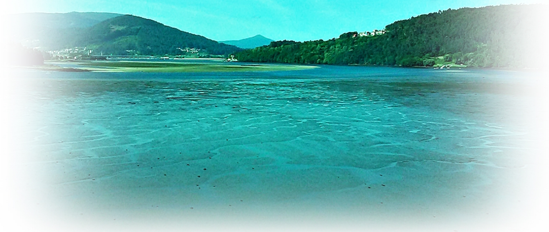
Vista panorámica de MUROS (La Coruña) 2015 aj*jb