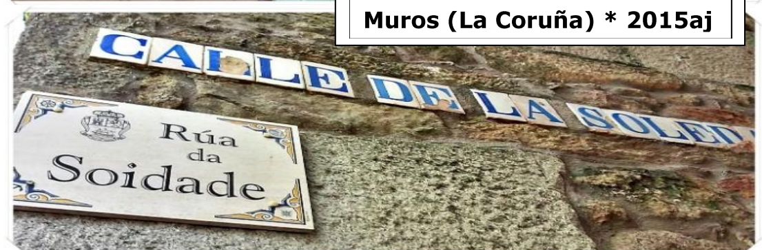
MUROS (La Coruña)