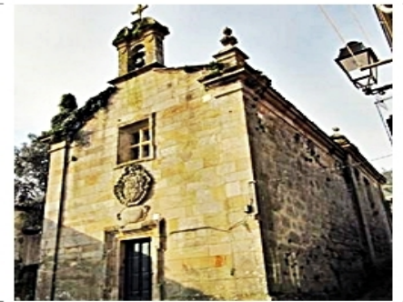
Capilla Virgen del Carmen MUROS (La Coruña)

Capilla del Carmen , siglo XVIII de estilo barroco y situada en la parte alta, con la imagen de la Virgen del Carmen, patrona de los pescadores, para la celebración de la fiesta.