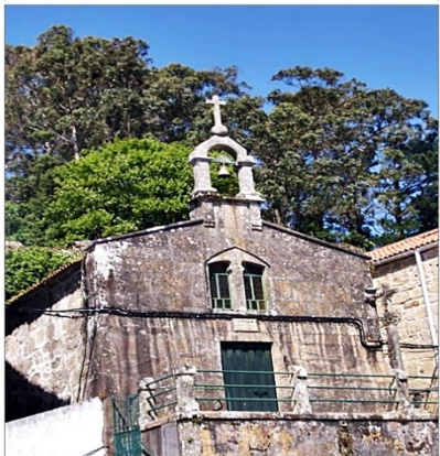
Capilla Nuestra Señora de los Remedios MUROS (La Coruña) * 2015jb

Capilla Nuestra Señora de los Remedios , siglo XVIII. Con el altar mayor de dos siglos diferentes, la base del siglo XVI y el resto del siglo XVIII.