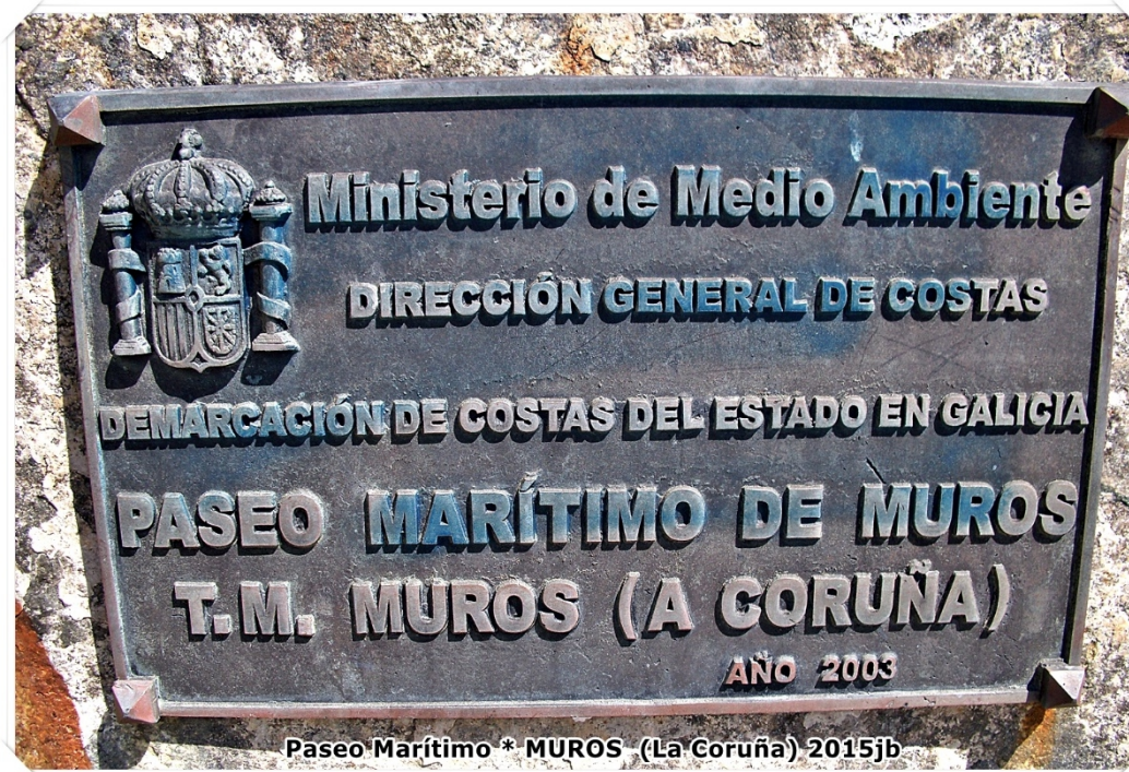
Paseo Marítimo * MUROS (La Coruña) 2015jb