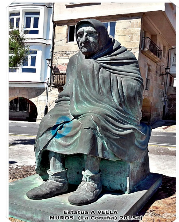
Estatua A VELLA MUROS (La Coruña) 2015aj

En la ría de Muros y de Noya hay muchas y buenas playas, pero en el pueblo de Muros solamente una muy pequeña (para los vecinos).