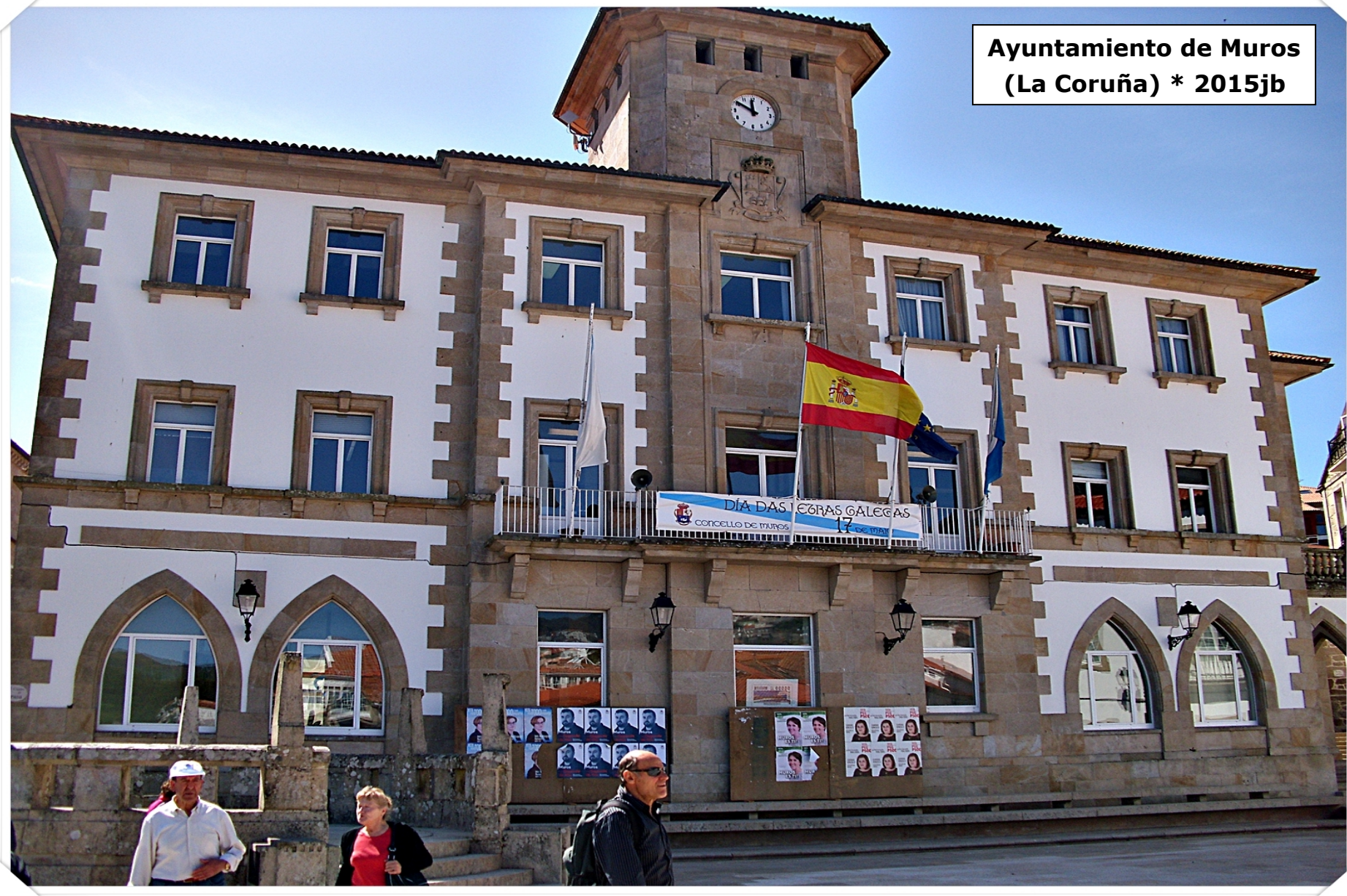
Ayuntamiento de Muros (La Coruña) * 2015jb