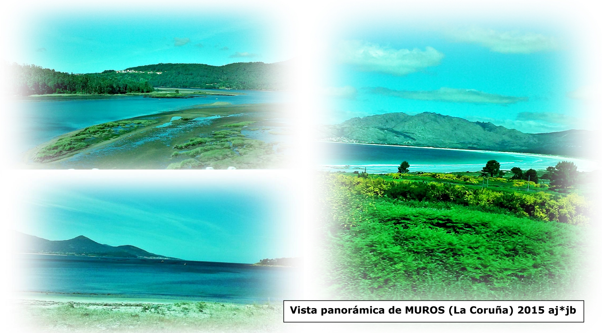
Vista panorámica de MUROS (La Coruña) 2015 aj*jb

Muchas, bonitas e interesantes. El monte Louro se ve desde toda la costa con playas y el lago donde hay cantidad de animales del ecosistema y muchísimas aves donde anidan, se le ha denominado Lugar de Interés Geológico.